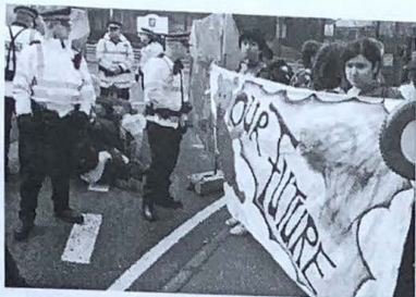
Faslane Gorffennaf 2007