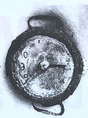
Hiroshima Peace Museum